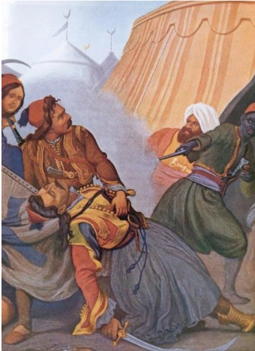
Ο Μπότσαρης αποθνήσκει στο Καρπενήσι. Εγχρωμη λιθογραφία. Πέτερ φον Ες.