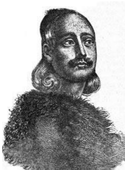
Ο Μάρκος Μπότσαρης Έργο του Τζοβάνι Μπόττσι