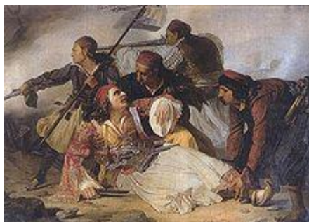
Ο θάνατος του Μάρκου Μπότσαρη Πίνακας από τον Ludovico Lipparini, που βρίσκεται στο μουσείο της Τεργέστης στην Ιταλία