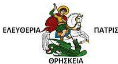
Η σημαία του Μάρκου Μπότσαρη.