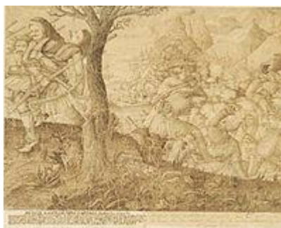
Ο θάνατος του Μάρκου Μπότσαρη, Μελανογραφία του Αθανασίου Ιατρίδη (. 4542). Εθνικό Ιστορικό Μουσείο