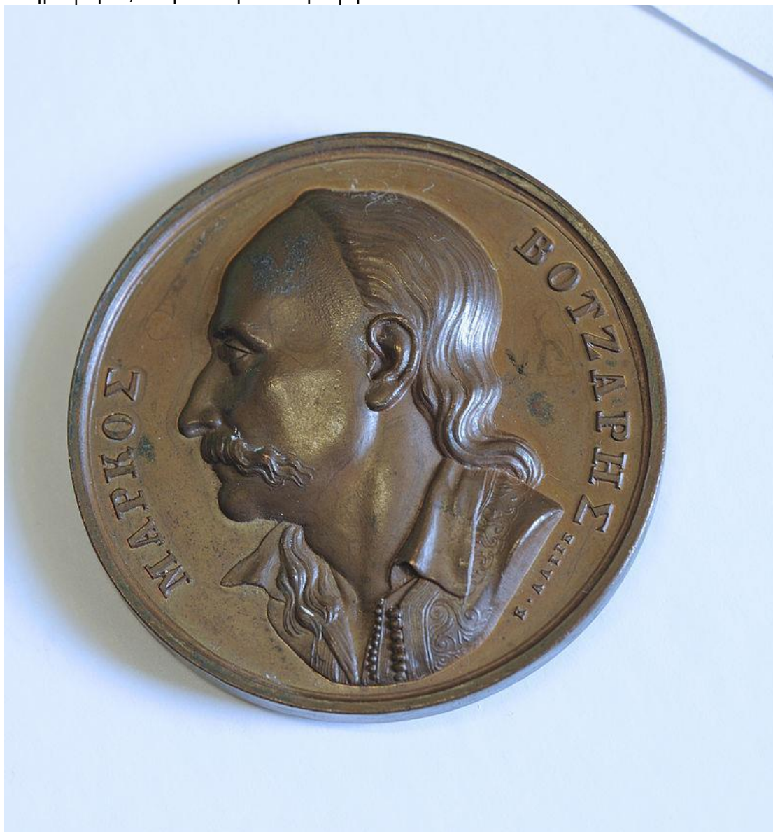
Ο Μάρκος Μπότσαρης. Αναμνηστικό μετάλλιο φιλοτεχνημένο από τον γλύπτη Κόνραντ Λάγγε το 1836. Εθνικό Ιστορικό Μουσείο.

και φαίνεται τα είχε επινοήσει ο ίδιος ο Μπότσαρης. Ο ίδιος γνώριζε λίγα γράμματα που πιθανώς είχε διδαχθεί από τον καλόγηρο Σαμουήλ ή, κατά μία πληροφορία, στη Μονή του Προφήτου Ηλιού.