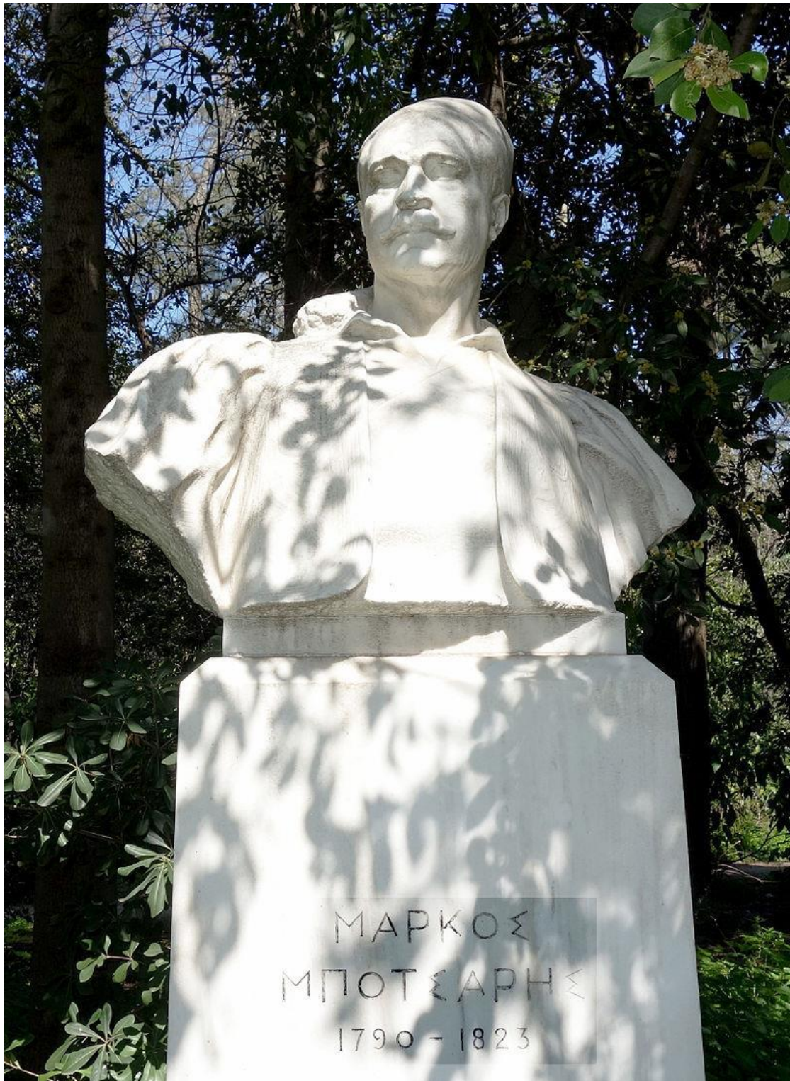
Προτομή του Μάρκου Μπότσαρη (έργο της Νίνας Εμπειρικού – 1937) στο Πεδίον το Άρεως.

Ο Μάρκος Μπότσαρης έμεινε στην ιστορία για την ανδρεία του και τη σημαντική συμβολή του στον Αγώνα για την ανεξαρτησία των Ελλήνων και δίκαια θεωρείται εθνικός ήρωας.