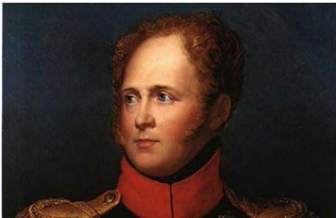
Τσάρος Αλέξανδρος Α΄ της Ρωσίας

Ο Παπαφλέσσας, φλογερός στο λόγο του, προχωρά σε μία σειρά από ανυπόστατους ισχυρισμούς που έχουν αρχίσει να πείθουν μια μερίδα προκρίτων.