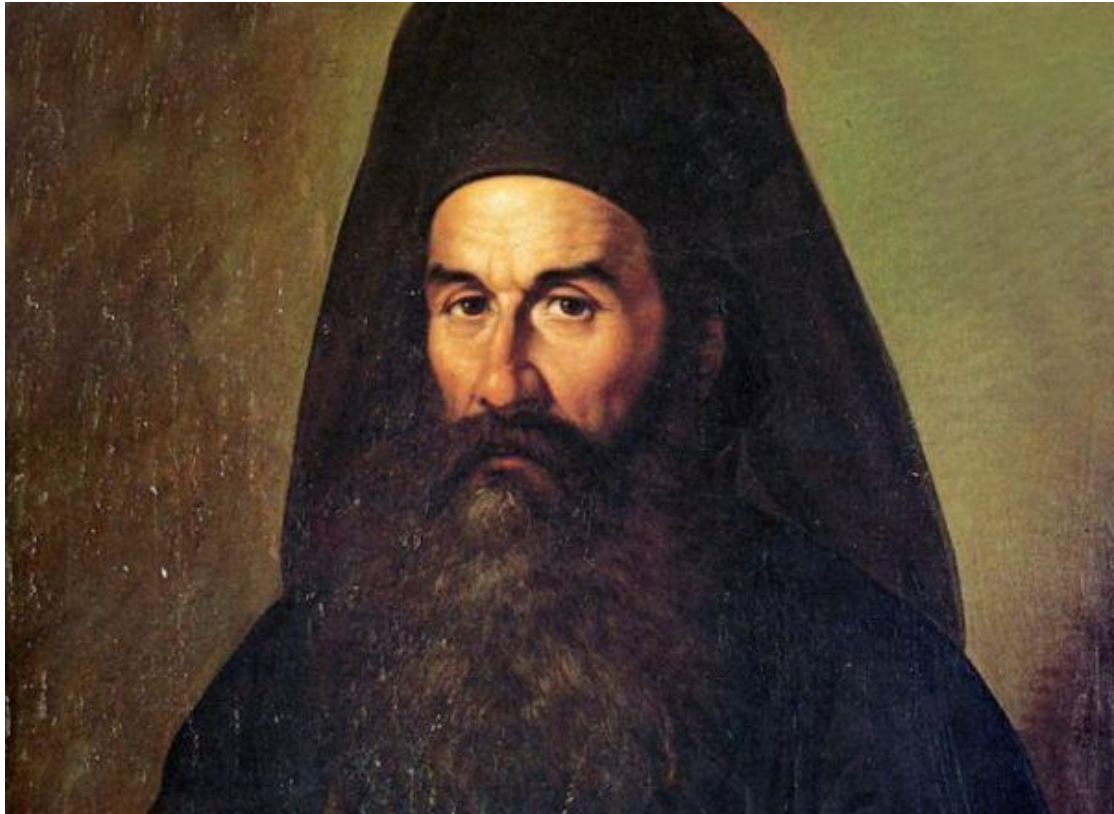
Παλαιών Πατρών Γερμανός